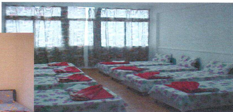
d. Camere cu 8 locuri – 20.